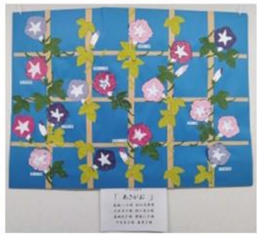
力作揃いのちぎり絵の朝顔

歩行訓練や風船バレーの他、作業療法の一環として、ロールピクチャや、和紙を使用したちぎり絵も製作しました。