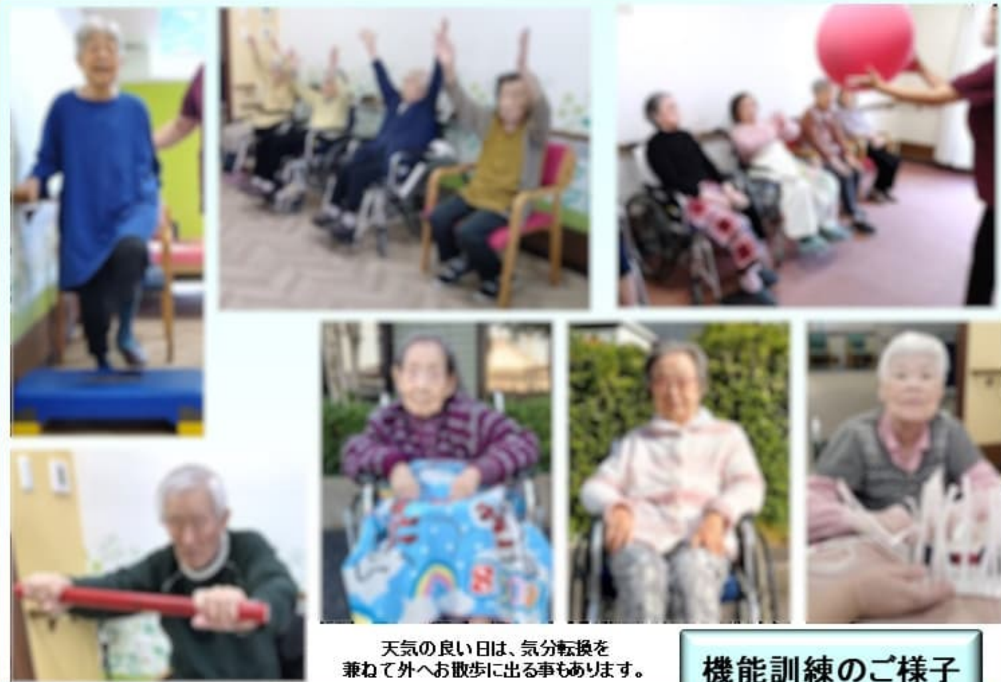
天気の良い日は、気分転換を兼ねて外へお散歩に出る事もあります。