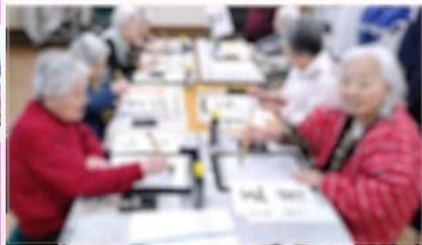
本番前にたくさん練習しました